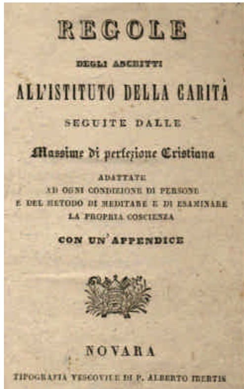
Prima edizione a stampa delle Regole degli Ascritti fatta a Novara nel 1842